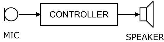
Fig.1 ハウリング・キャンセラ付き拡声システムの単純化したハードウェア構成

ハウリング・キャンセラ付き拡声システムのハードウェア構成を単純化してあらわすとマイク→コントローラ→スピーカとなります。（Fig.1）